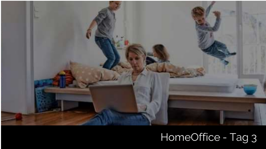
HomeOffice - Tag 3