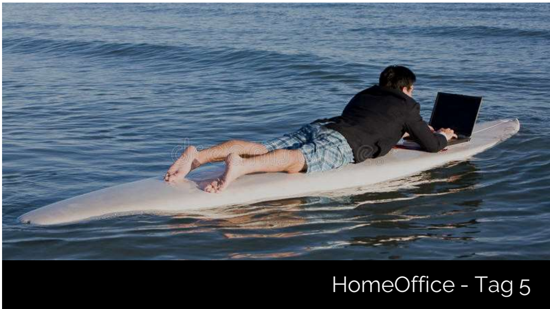
HomeOffice - Tag 5